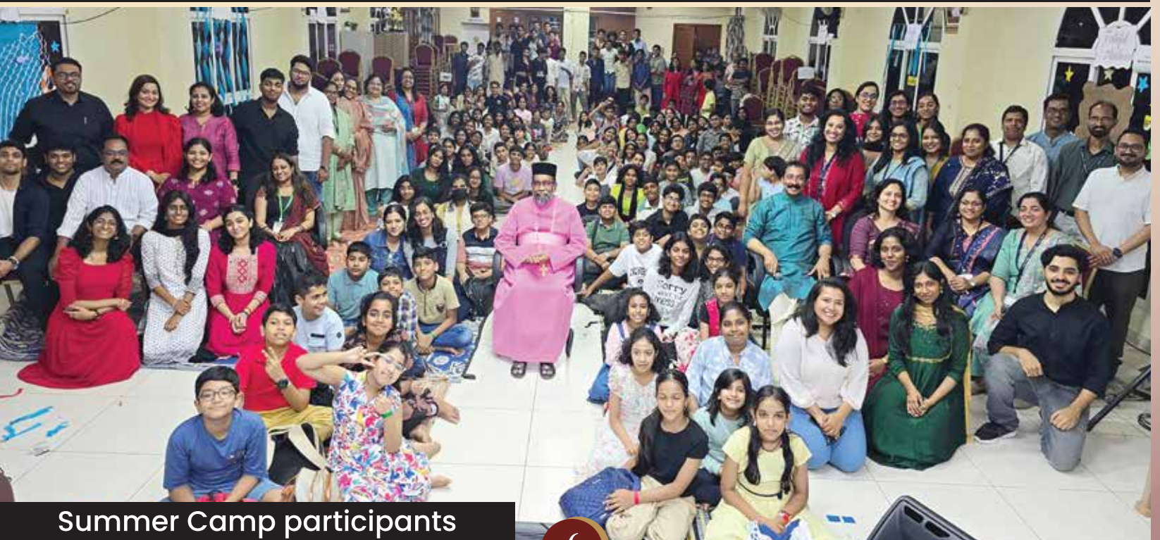
Summer Camp participants