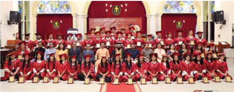
Sunday School - 18th Batch Graduation Ceremony of Grade-12 ORTHODOX VEDAPRAVEEN DIPLOMA Holders