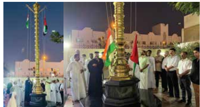
രാജ്യത്തിന്റെ 76-ാം റിപ്പബ്ലിക്ക് ഡേ ദിനത്തോടനുബന്ധിച്ച് ഇടവക കൊടീമരത്തിൽ പതാക ഉയർത്തുകയും മധുരപലഹാരം വിതരണം ചെയ്യുകയും ചെയ്തു.