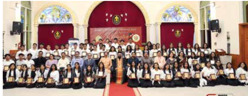
Parish Memento Presentation to Class-10 OSSAE-OKR Exam passed Students.