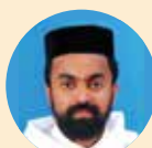
Fr. Oommen Mathew St. Gregorios Orthodox Church Jebel Ali