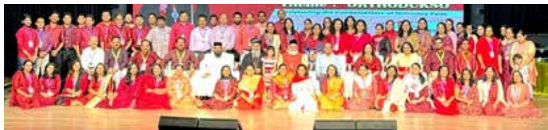
Sunday School Teachers' UAE Annual Conference at Fujairah Convention Centre.