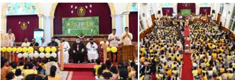
OVBS -2024 Classes successfully conducted between 31st March till 6th April