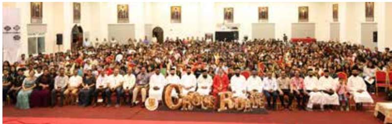
Sunday School UAE Sub-Region Teenager's Camp CrossRoads held at Dubai Cathedral.