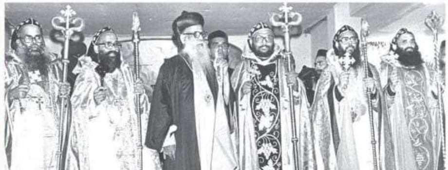
മാവേലിക്കര പുതിയകാവിലെ സെന്റ് മേരീസ് കത്തീഡ്രലിൽ 1985-ൽ വാഴിക്കപ്പെട്ട നവാജിയിലെ മെത്രാന്മാരുടെയും നേതാവാണ് തിരുമേനിയുടെയും. അദ്ദേഹം മലങ്കര സഭയെ വളരെ ധീരമായി നയിച്ച മെത്രാന്മാരുടെയും. അദ്ദേഹത്തിന് പല വിഷയങ്ങളിലും വ്യക്തവും ധീരവുമായ നിലപാടുകളും സഭയെ കുറിച്ചു വ്യക്തമായ ദർശനങ്ങളും ഉണ്ടായിരുന്നു. പുത്തൻകാവിലെ കൊച്ചുതിരുമേനിയുടെയും പ. വട്ടപ്പാറയുടെയും ശിഷ്യന്മാരാണ് അദ്ദേഹത്തിന് ലഭിച്ചിട്ടുള്ളത്.